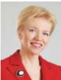
prof. Tatjana Koķe izglītības un zinātnes ministre

Profesionālajā izglītībā ir sācies ļoti nozīmīgs attīstības posms – kvalitātes, meistarības un rezultātu laiks. Liekot lietā jau uzkrāto bagāto pieredzi, ieviešot jauninājumus un izmantojot Eiropas Savienības struktūrfondu atbalstu, veidojam prestižu profesionālās izglītības sistēmu, kas nodrošinās augstu profesionālās izglītības kvalitāti atbilstoši ne tikai šī brīža, bet arī nākotnes darba tirgus prasībām un vajadzībām. Iesāktais darbs ir strauji jāturpina jaunajā mācību gadā, neko no tā, ko var padarīt šodien, neatliekot uz rītu.